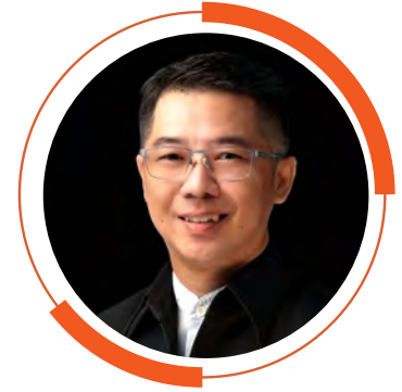
บสสพต พิจิตรกำเนิด