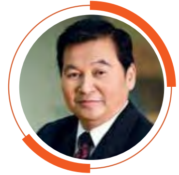
รศ. ดร.สุขุม เจลยทรัพย์ ประธานที่ปรึกษาอธิการบดี มหาวิทยาลัยสวนดุสิต